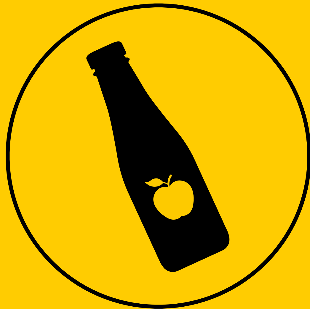
Первичная или товарная