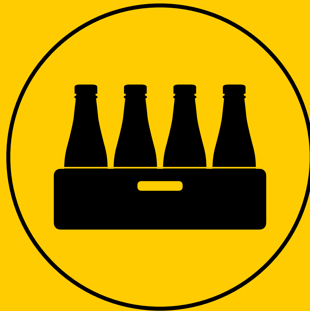
Вторичная или фасовочная