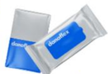
Влажные салфетки, твердое мыло