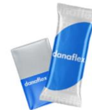
Мороженое, сл масло