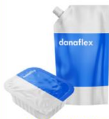
Соусы, майонез, кетчуп