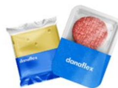
Сыр, мясные продукты