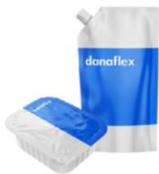
Соусы, майонез, кетчуп