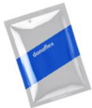
Специи и приправы