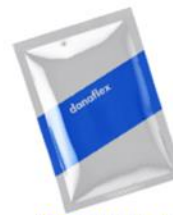
Специи и приправы