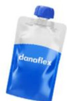
Пюре и дойпаки