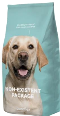
Корма для животных