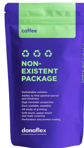
Моноструктура Перерабатываемое решение