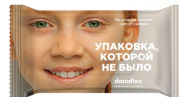
Для влажных салфеток