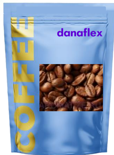
РЕТ/Аlu/РЕ Традиционная структура