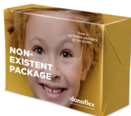
Сливочное масло, творог