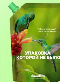
Пакеты для косметических средств