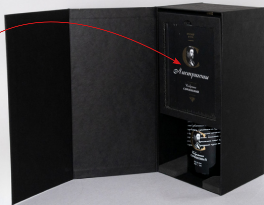
Книга в ложементе

Стилистическое решение оформления упаковки: