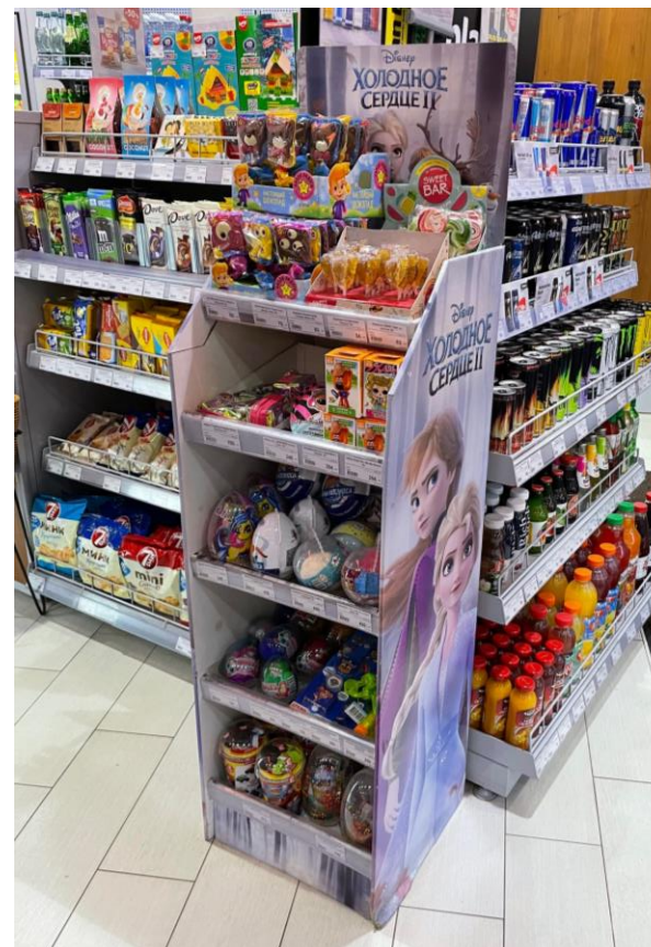
Игрушки в магазине у дома