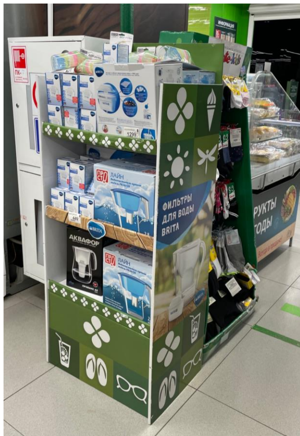
Фильтры для воды в Перекрестке