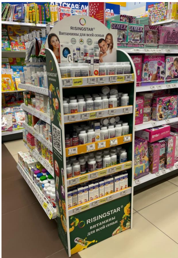
БАДы в ДМ