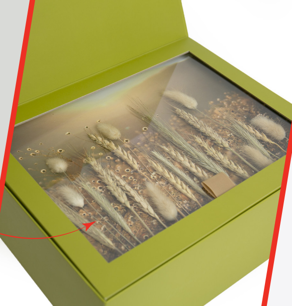
Панно из растений