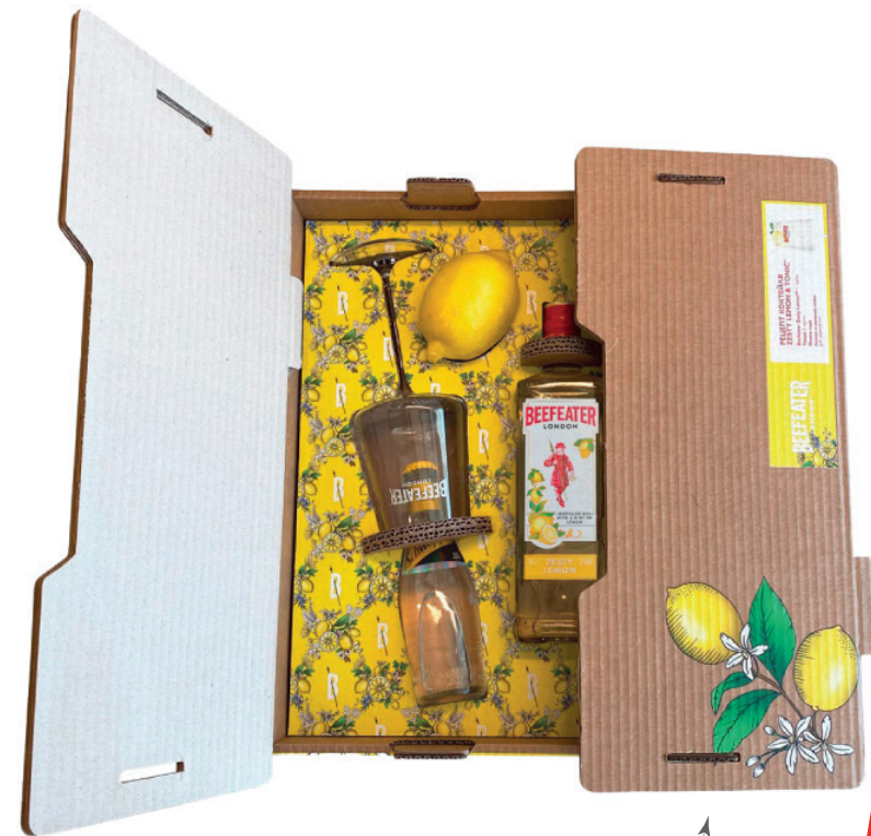
Открытая волна гофрокартона