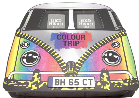
ЛЕГЕНДАРНЫЙ АВТОБУС VOLKSWAGEN